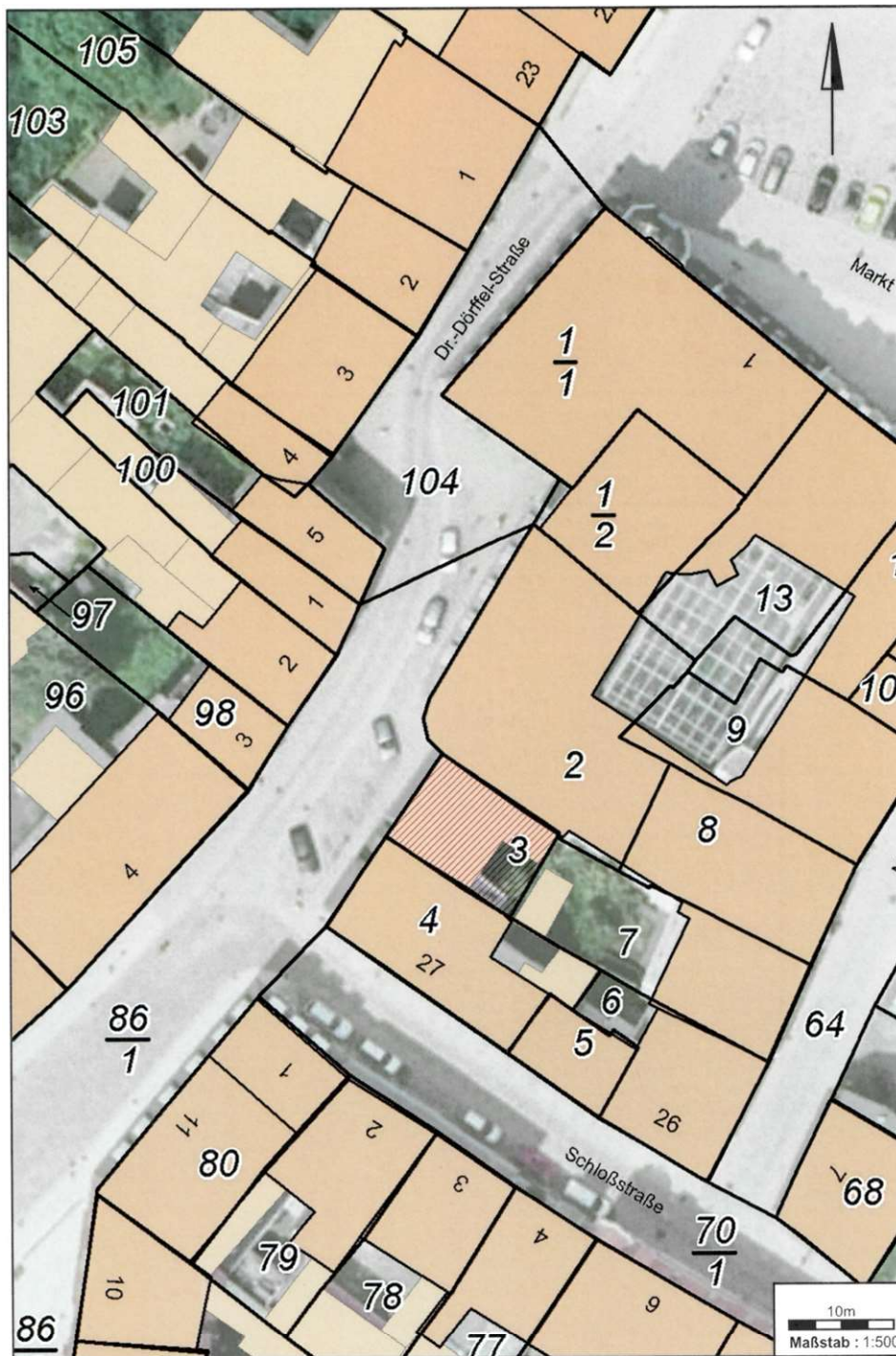
Luftbild mit Grundstück