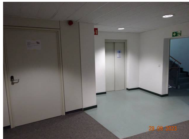
Zugang Treppenhaus / Fahrstuhl